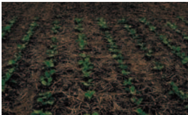
Abb. 5: Gut aufgelaufener Zuckerrübenbestand in Senfmulch. Die abgefrorene Senfstoppel wurde unmittelbar vor der Saat mit einer Kreiselegge zerkleinert.

Der Anbau von Zwischenfrüchten schützt im Herbst und Winter vor Bodenabtrag und verringert das Erosionsrisiko in der kritischen Zeit bei spät zu säenden und sich langsam entwickelnden Hauptfrüchten (Mais, Rüben). Erosionsschutz im Frühjahr wird besonders mit sehr flacher Einarbeitung oder Direktsaat erreicht. Abfrierende Zwischenfrüchte bringen ein sehr geringes Durchwuchrisiko und machen einen Herbizideinsatz zum Abtöten der Zwischenfrucht überflüssig. Der spätsaatverträgliche Senf ist für diesen Zweck sehr gut geeignet und wird in der Praxis am häufigsten verwendet. Das Merkblatt „Ackerböden vor Erosion schützen“ beschreibt im Detail die Anforderungen von Mulchsaaten vor verschiedenen Fruchtarten.