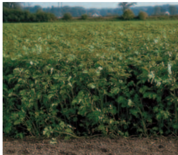
Abb. 4: Üppiger Senfbestand, der Unkraut unterdrückt und die Bodengare fördert

Die großkörnigen Leguminosen werden im Zwischenfruchtbau nur mehr vereinzelt angebaut. Hauptursache sind die hohen Saatgutkosten. Im Gemengeanbau werden diese Kulturen als Gründüngung gebietsweise geschätzt. Ein Problem stellen aber die erhöhten Nitratwerte nach Umbruch dar.