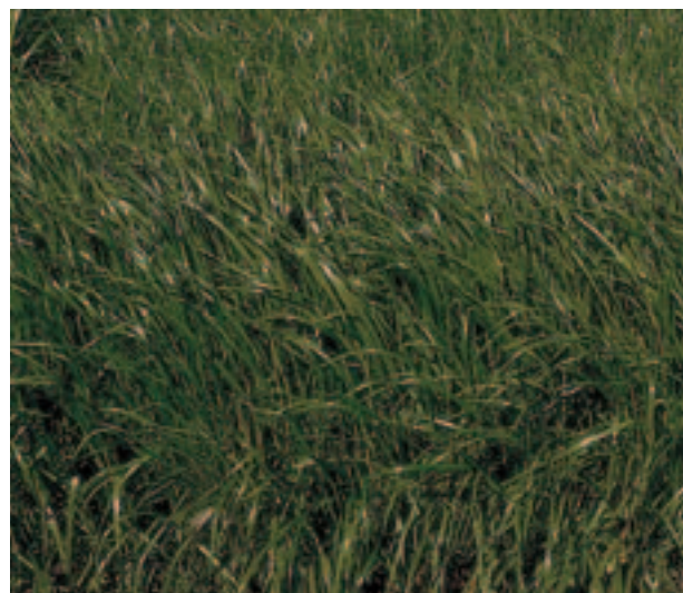
Abb. 2: Einjähriger optimaler Weidelgrasbestand

Das einjährige Weidelgras schießt als sommerjährige Art und ist deshalb im Gehalt an strukturierter Rohfaser günstiger zu bewerten als das Welsche Weidelgras, das im Ansaatjahr keine Halme bildet. Welsches Weidelgras ist auch für Winterzwischenfruchtbau geeignet. Bei beiden Arten sind diploide und tetraploide Sorten vorhanden. Die diploiden Sorten weisen einen geringfügig höheren Trockensubstanzgehalt auf. Bei beabsichtigter Silierung können diploide Sorten vorteilhaft sein. Gräser reagieren schon auf kurzzeitigen Wassermangel mit Wachstumsstillstand und/oder der Bildung von Halmen. Damit verbunden ist dann auch ein rascher Qualitätsabfall des folgenden Schnittes. Deshalb ist der Anbau nur in Gebieten mit sicheren Niederschlägen zu empfehlen. Das Risiko einer fehlgeschlagenen Ansaat ist jedoch nie ganz auszuschließen. Bei der Sortenauswahl sollte speziell auf die Rostresistenz geachtet werden, da ein beginnender Befall nur durch Vorziehen des Schnittermins mit hohen Ertragsverlusten abgemildert werden kann. Wegen der Gefahr des Wiederaustriebes ist der Einarbeitung der Grasnarbe größte Sorgfalt zu widmen.