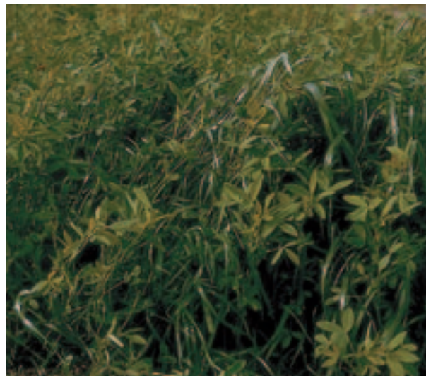
Abb. 3: Kleebetonte Mischung aus einjährigem Weidelgras und Alexandrinerklee

Gegenüber der Grünfütterung bietet die Silagebereitung den Vorteil, dass der gesamte Aufwuchs zum optimalen Termin hinsichtlich Ertrag und Futterqualität genutzt werden kann. Bei einjährigem Weidelgras sind sehr früh schossende Sorten und spätere Sorten auf dem Markt. Um eine hohe Energiekonzentration zu erreichen, ist ein Schnitttermin zu Beginn des Ährenschiebens wegen dann rascher Rohfaserzunahme anzustreben. In Mischungen aus Gräsern und Klee sollten Sorten mit gleichem Entwicklungsrhyth-